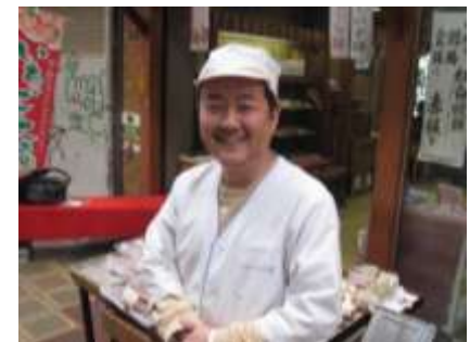
先代から地元まつわる銘菓を受け継いでいます。