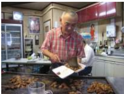
この匂いがたまらない！庶民派の名物ホルモンをつまみます！