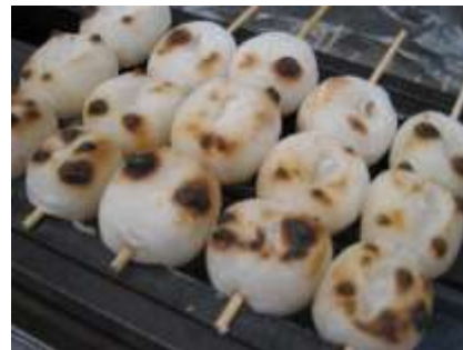
商店街の老舗和菓子屋で焼き立てお団子をいただきます。