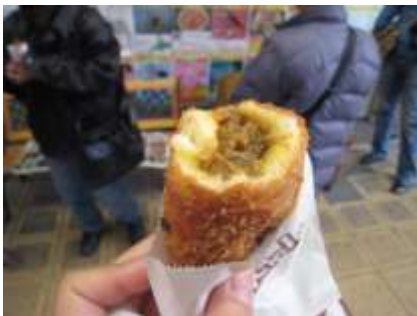
商店街 3 店舗のコラボ商品、揚げたての手作りカレーパンは絶品！