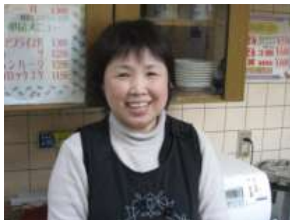
カレーパンを生んだカレー屋さん。パンの中身にはどんな工夫が？