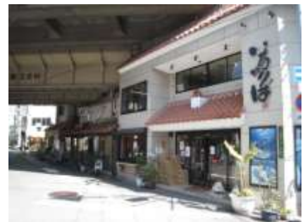
大正駅周辺には居酒屋がズラリ。沖縄名物ポークたまごもありますよ！